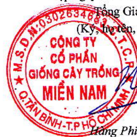
Hàng Phi Quang